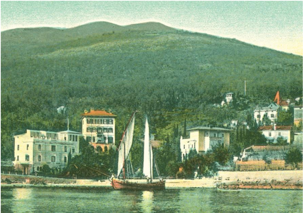
Carl Seidl, vila Ransonnet, Opatije