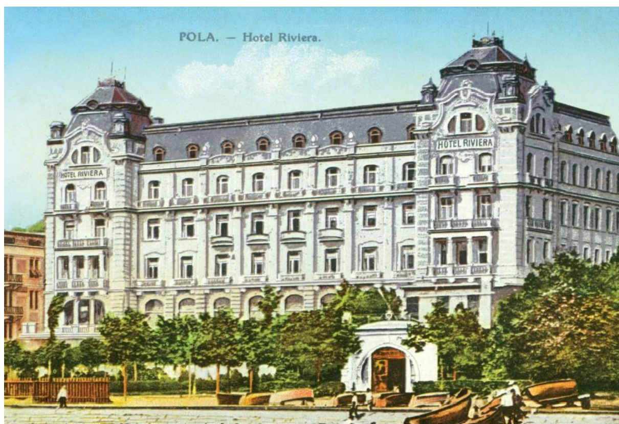
Carl Seidl, hotel Riviera, Opatjje